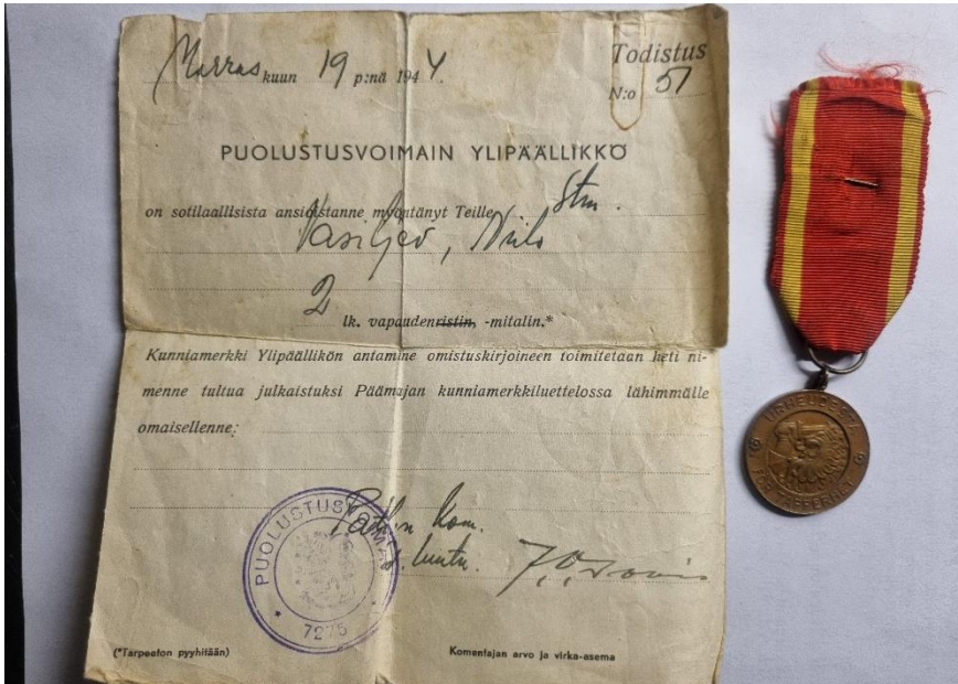
Niilo Vasiljevin vapaudenristi