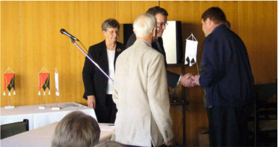
Vaittisten sukuseuran 10-vuotisjuhlan kuvia (Risto Vaittinen06)

Paluumatkalla Tallinnassa järjestetään aikaa ostoksille. Sunnuntaina 19.8. iltapäivällä ollaan Helsingissä ja hyvissä ajoin illalla jo Joensuussakin. Matkan tarkempi ohjelma lähetetään vain ilmoittautuneille ensi kesään mennessä. Tervetuloa taas viihtymään suvun yhteiselle matkalle!