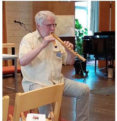
Konstit on monet sanoi Paroni, kun duettoja yksinään soitteli...

Sain ensikosketuksen tähän sielukkaaseen ja herkkätuntoiseen taiteilijaan puhelimesta, kun vähän jännittyneessä tilassa lähestyin miestä hänen säveltämänsä Vaittis-valssin vuoksi. Enhän tiennyt mikä mörkö minulla on vastassa, kun en tuntenut miestä henkilökohtaisesti lainkaan. Tuo ensimmäinen puhelinkeskustelu kesti toista tuntia; juttua piisasi kahdella suulaalla, kaikki asiat käsiteltiin maailmoja syleillen ja huumorin sävyttämänä, ja paljon naurettiin. Puhelinkeskusteluja ja sähköpostiviestejä vaihdettiin sittemmin muutaman kerran, ja aina tietty karjalainen eloisuus ja optimistisuus väritti ajatuksenvaihtoa, vaikka synkimmässä koronassa elettiin.